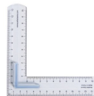
Modèle de l'équerre

• Vous pouvez utiliser votre matériel de l'an- née passée, si celui-ci est en bon état.